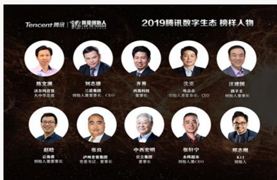
2019腾讯数字生态 榜样人物

2019年5月21日~5月23日，2019腾讯全球数字生态大会在昆明滇池国际会展中心举行，这是腾讯2019年最为重磅的一次大会，也是腾讯宣布整合三大会议（腾讯全球合作伙伴大会、腾讯云+未来峰会、中国互联网+数字经济峰会）之后举行的首次全球数字生态大会。