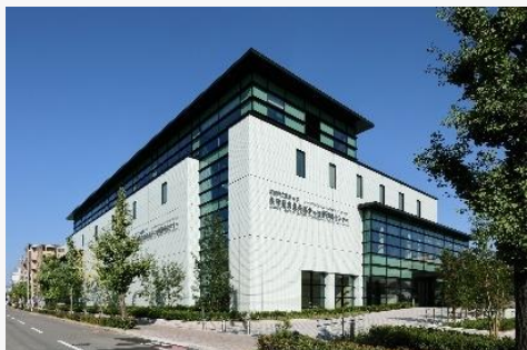
永守纪念尖端癌症治疗研究中心

株式会社日立制作所（以下简称，日立）此前表示，日立为日本京都府立医科大学永守纪念尖端癌症治疗研究中心